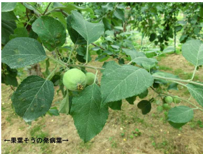
[果葉そうに限られた発病葉(令和元年6月撮影)]