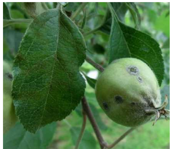
[発病果(平成30年6月撮影)]