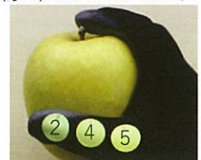
▲カラーチャートシール