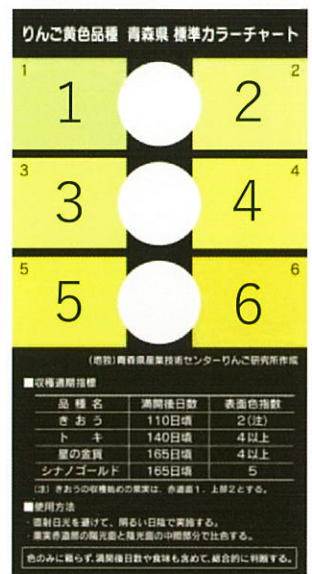
▲標準カラーチャート