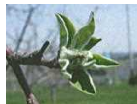
ふじの展葉1週間後頃

「ふじの展葉1週間後頃」の散布時期は、黒石、弘前、三戸で4月17～18日頃と見込まれる。地域や天候によっては散布時期が異なるので、展葉日や気象情報を参考にして適期に散布する。また、モニリア病の葉腐れの防除上、最も重要な時期なので、確実に行う。