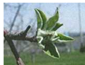
ふじの展葉1週間後頃

「ふじの展葉1週間後頃」の散布時期は、黒石、弘前、三戸で4月14～15日頃と見込まれる。地域や天候によっては散布時期が異なるので、展葉日や気象情報を参考にして適期に散布する。また、モニリア病の葉腐れの防除上、最も重要な時期なので、確実に行う。