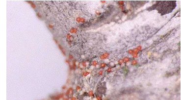
【リンゴハダニの越冬卵】