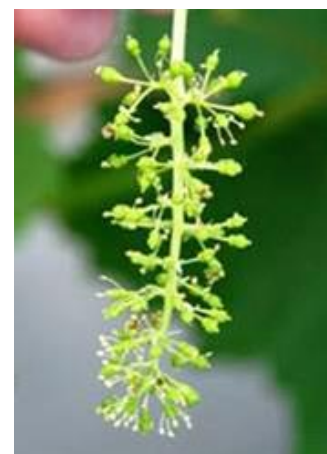
満開時のシャインマスカットの花穂

満開3～5日後 (落花期) に、フルメット10ppmを加用したジベレリン25ppm溶液に花房浸漬する。