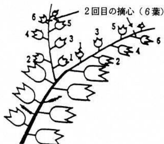
キャンベル・アーリーの摘心 (2回目)