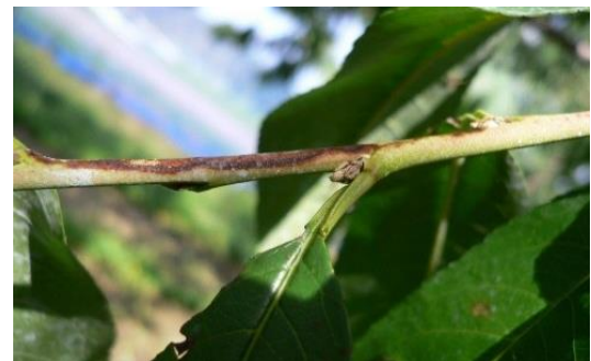
せん孔細菌病夏型枝病斑

6～8月に新梢に発生する夏型枝病斑は重要な伝染源になるので、速やかに枝ごと切り取り、適切に処分する。