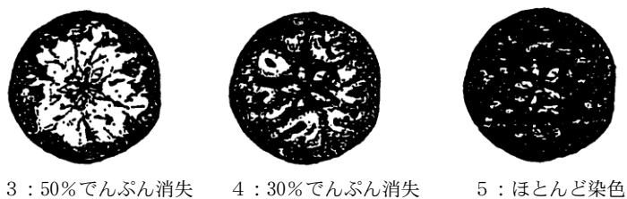
地色の見方（ていあ部）