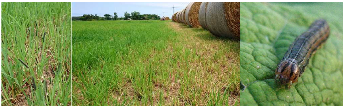
〔参考〕 採草地の食害状況 多発集団型黒色幼虫（中～老齢 体長2～4cm 頭部の八字状の模様）