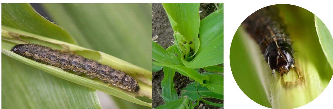
〔参考〕 とうもろこし類の食害状況 ツマジロクサヨトウ幼虫頭部の逆Y字状の模様

6月15日現在、糖蜜トラップや県内3地点に設置した性フェロモントラップには捕獲されていない。なお、各種トラップを設置した近隣のスイートコーン作付ほ場や飼料用トウモロコシ作付ほ場において、本種幼虫による食害株は確認されていない。